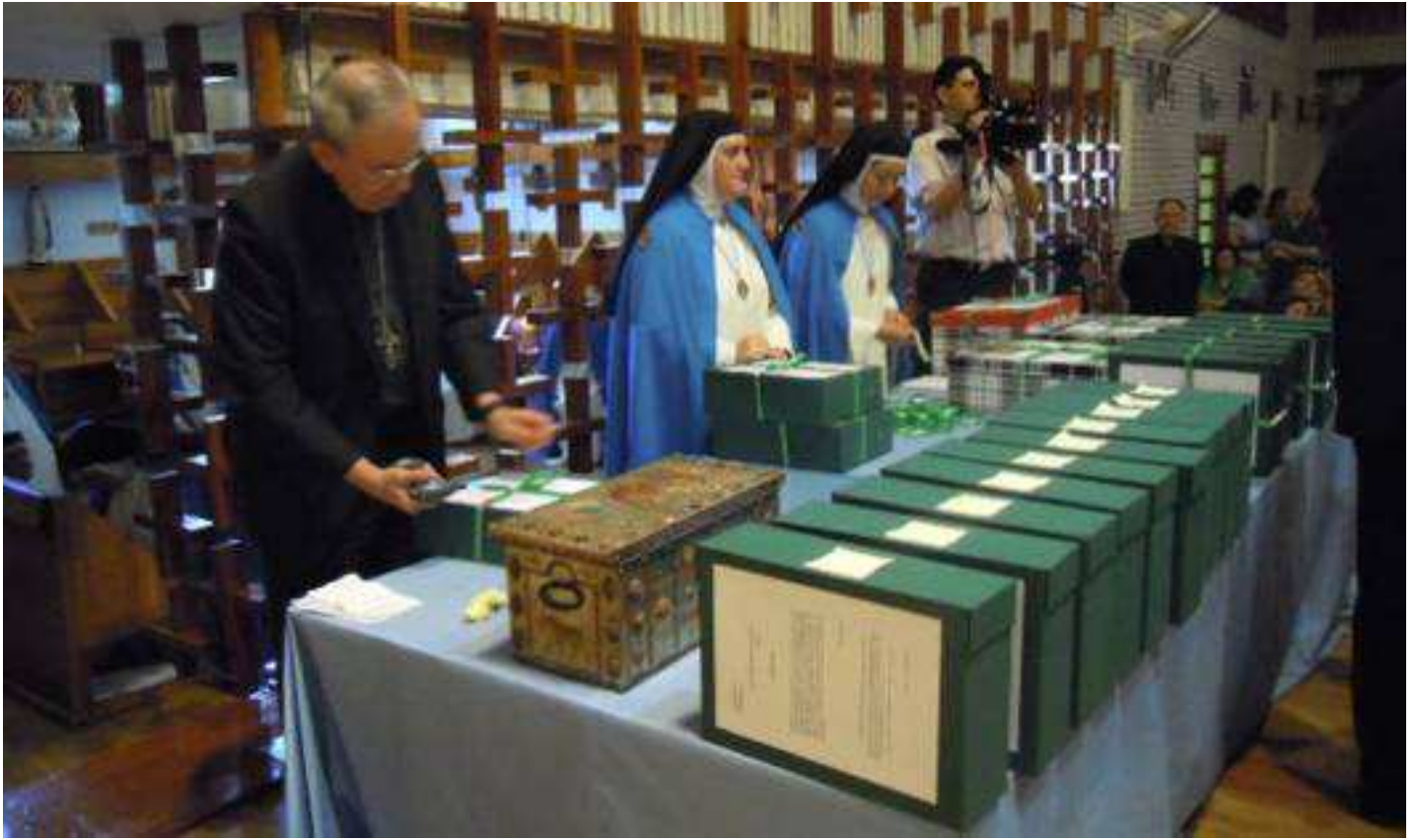
Nuestro Sr. Obispo, Madre Abadesa y su secretaria atando y lacrando las cajas.