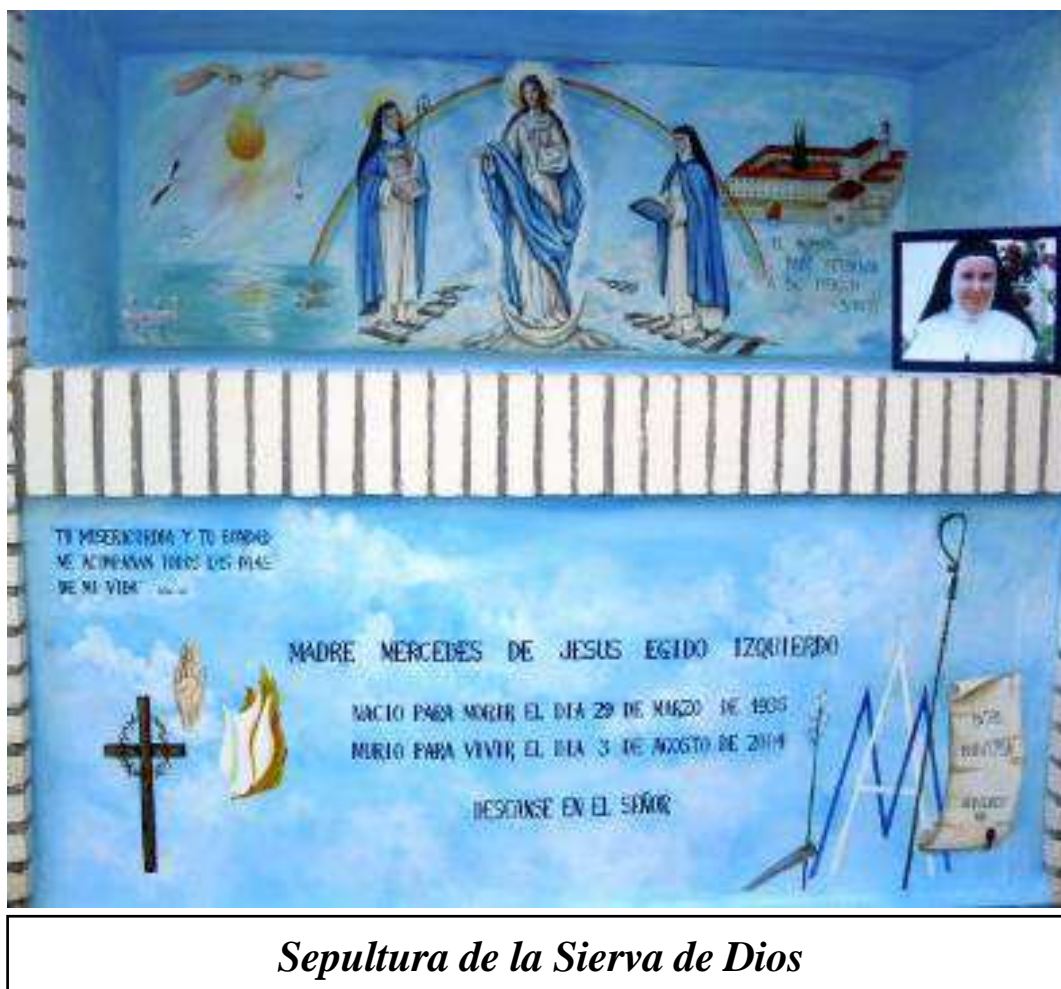
Sepultura de la Sierva de Dios